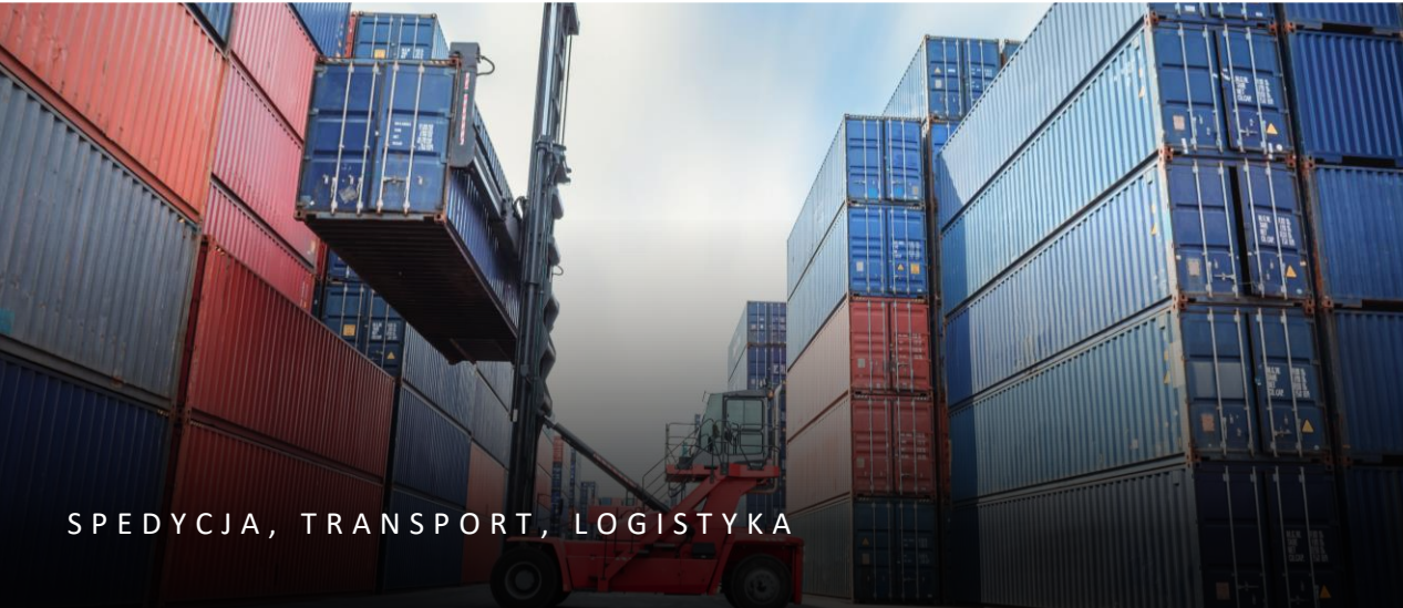
SPEDYCJA, TRANSPORT, LOGISTYKA