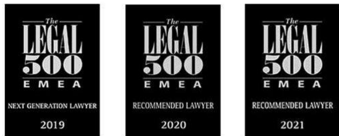
THE LEGAL 500 – REKOMENDOWANY PRAWNIK 2019-2021 R.