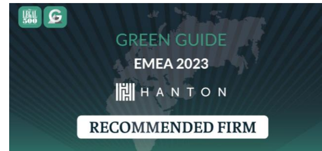
THE LEGAL 500 GREEN GUIDE – REKOMENDOWANA KANCELARIA W 2023 R.