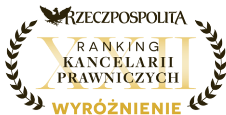
RANKING KANCELARII PRAWNICZYCH RP – REKOMENDOWANA KANCELARIA W 2024 R. REKOMENDOWANY PRAWNIK W 2024 R.

+ Jesteśmy dumni z otrzymanych nagród. Najbardziej jednak cieszy nas fakt, że cieszymy się nieustającym zaufaniem naszych Klientów, którzy powierzają nam swoje najtrudniejsze i najbardziej ambitne projekty.