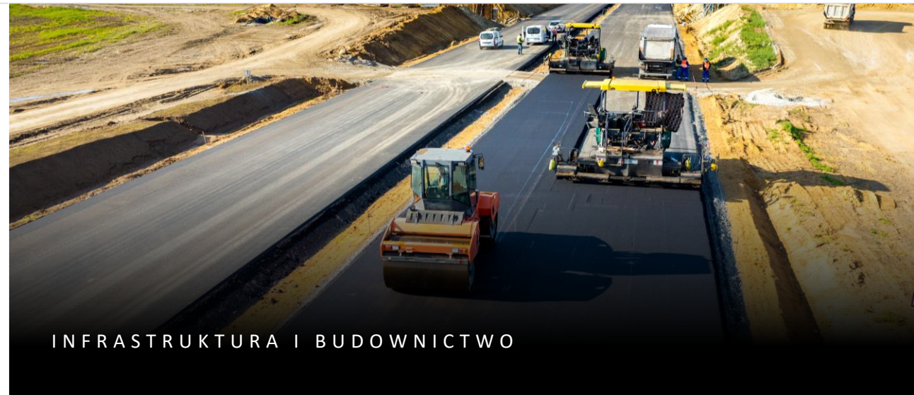
INFRASTRUKTURA I BUDOWNICTWO