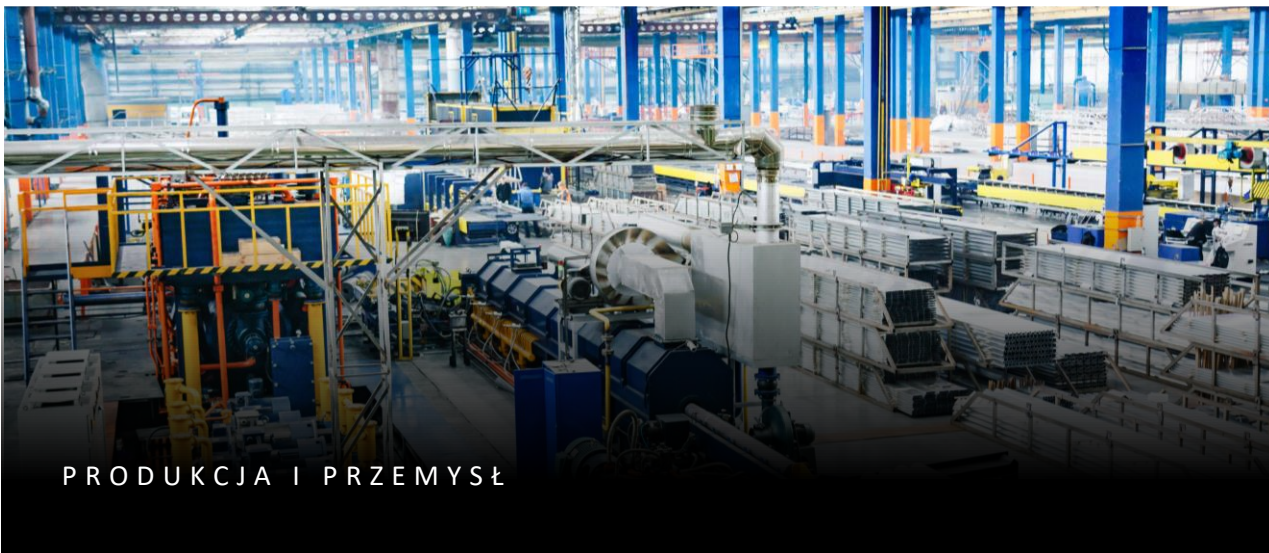
PRODUKCJA I PRZEMYSŁ