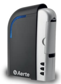
Aerte Klean w pomieszczeniach do 100m 3