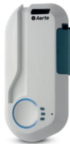
Aerte AD2.0 w pomieszczeniach do 300m 3