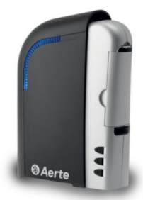
Aerte Klean w pomieszczeniach do 100m 3